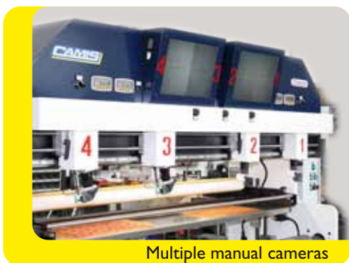
Multiple manual cameras