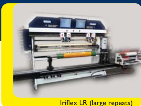
Iriflex LR (large repeats)