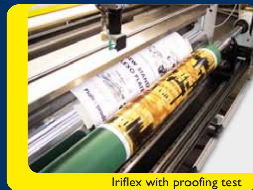
Iriflex with proofing test