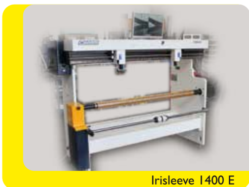
Irisleeve 1400 E